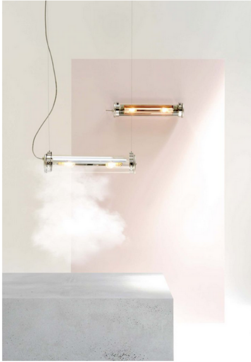
Rimbaud on, Sammode

Light Lady par Normal Studio pour Sammode et Cassina